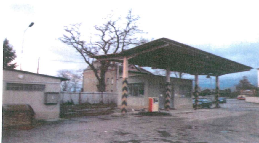
Pohled na zpevněnou plochu