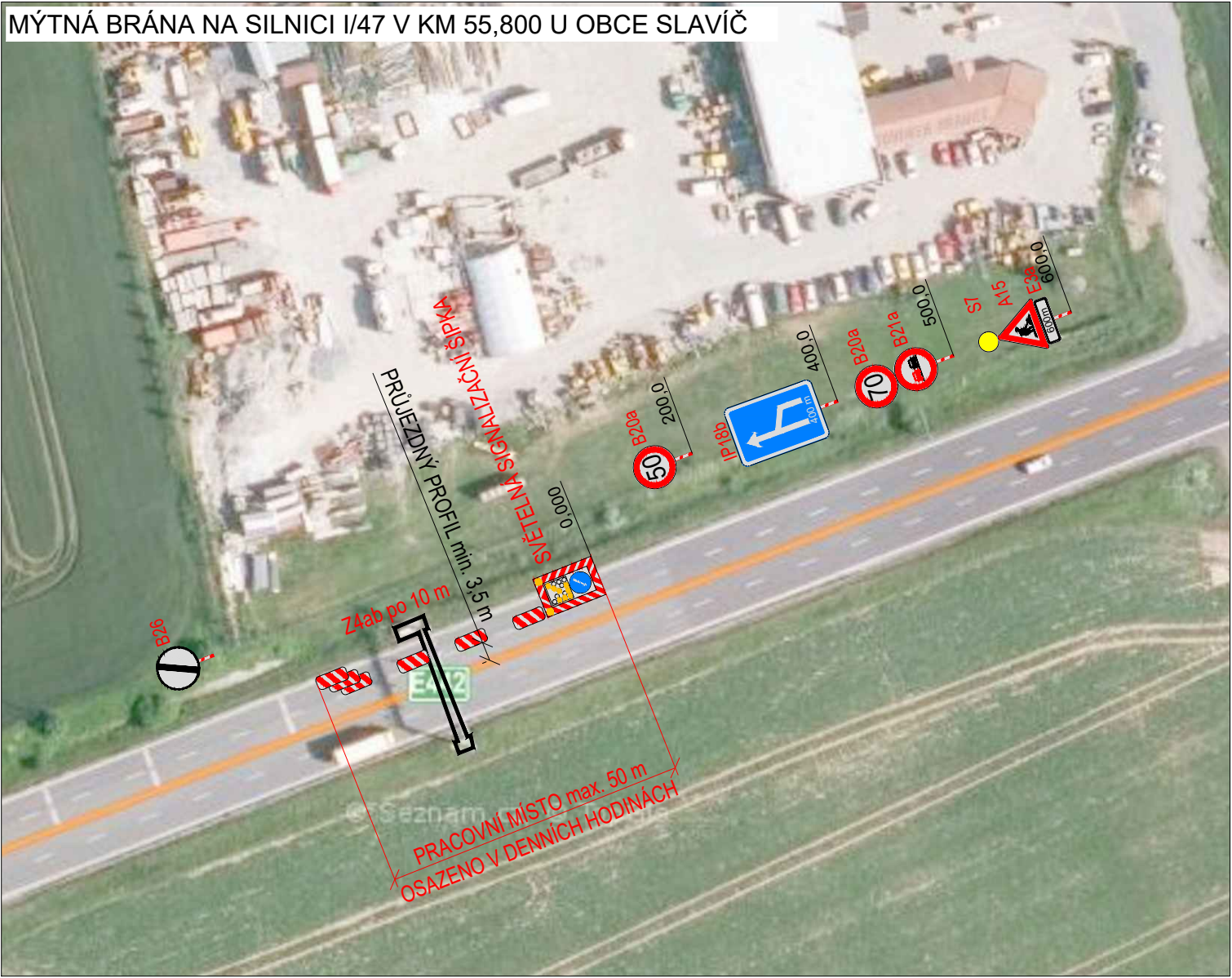
MÝTNÁ BRÁNA NA SILNICI I/47 V KM 55,800 U OBCE SLAVÍČ