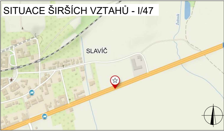
SITUACE ŠIRŠÍCH VZTAHŮ - I/47