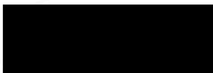
Město Šumperk Mgr. Tomáš Spurný starosta města